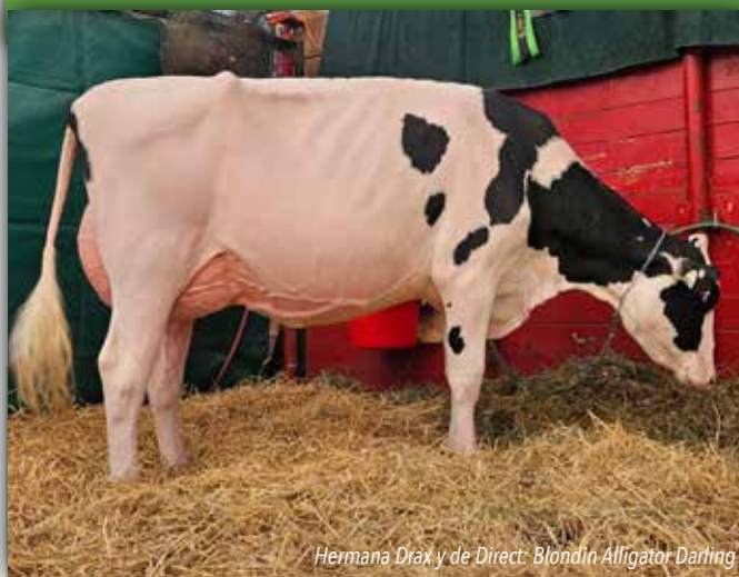
Hermana Drax y de Direct: Blondin Alligator Darling

ALLIGATOR x DELTA-LAMBDA x ABBOTT CANM0121105875 799H000089 17/04/2022