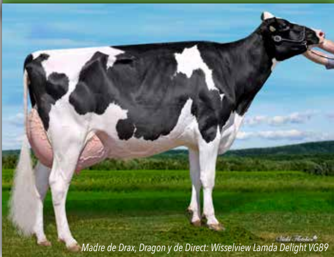
Madre de Drax, Dragon y de Direct: Wisselview Lamda Delight VG89

ALLIGATOR x DELTA-LAMBDA x ABBOTT CANM0121105878 799H000100 25/04/2022