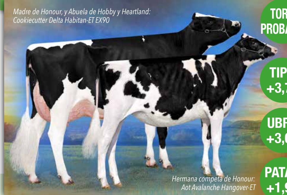
Hermana competa de Honour: Aot Avalanche Hangover-ET

Madre de Honour, y Abuela de Hobby y Heartland: Cookiecutter Delta Habitan-ET EX90