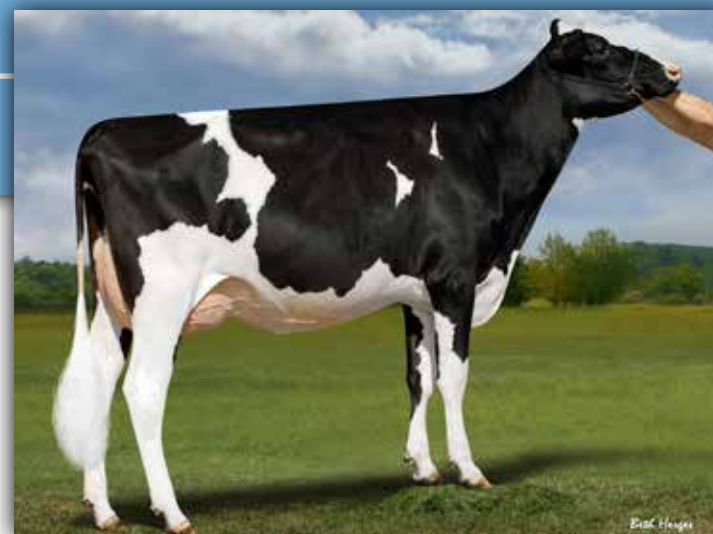
Madre: Duckett Perfect Hallie-ETVG87 y Abuela: S-S-I Doc Have Not 8784-ET EX96