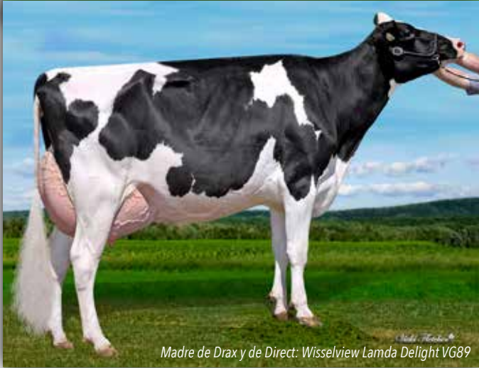
Madre de Drax y de Direct: Wisselview Lamda Delight VG89

ALLIGATOR x DELTA-LAMBDA x ABBOTT CANM0121105878 799H000100 25/04/2022