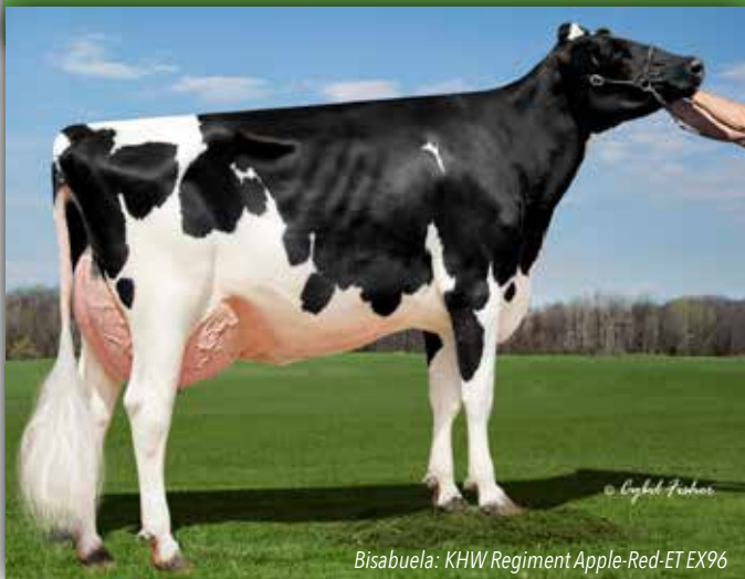
Bisabuela: KHW Regiment Apple-Red-ET EX96

ALLIGATOR x HOTLINE x DELTA CANM0120345247 799H00051 23/12/2020