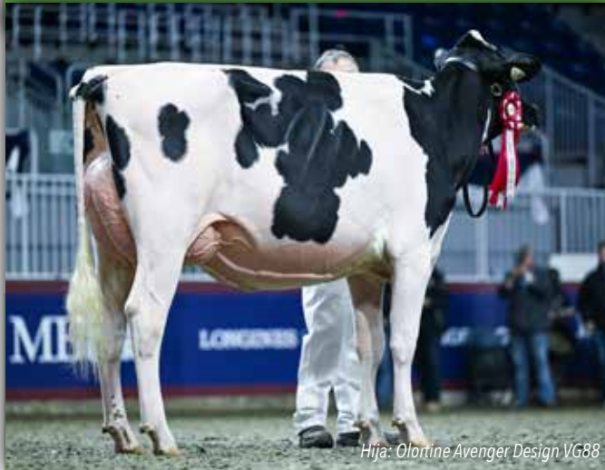
Hija: Olortine Avenger Design VG88

ROZUME x DELTA-LAMBDA x EXTREME CANM0120213097 799H000027 22/11/2019